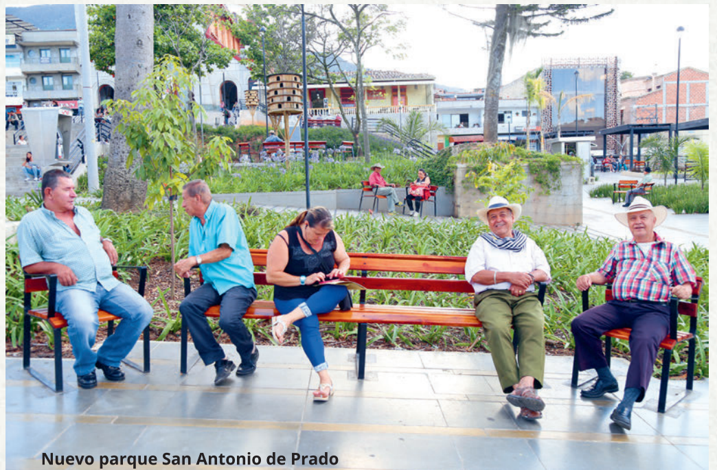
Nuevo parque San Antonio de Prado