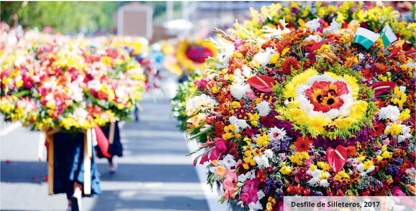
Desfile de Silleteros, 2017

“Me siento privilegiado al celebrar, junto a los silleteros, los primeros 60 años de su desfile. Veo en ellos a verdaderas personas que representan el compromiso, la entrega, la disciplina y la dedicación de la cultura antioqueña, valores que fortalecen a la sociedad”.