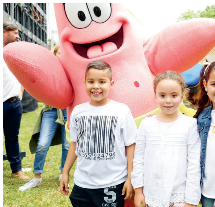
Día del Juego 2017

De la estrategia Tejiendo Hogares también hace parte el Festival Buen Comienzo, que este año llegó a su novena versión, y que tuvo una asistencia de más de 80.000 visitantes, en una apuesta que reunió en un solo lugar oferta pedagógica y lúdica para la primera infancia, que hizo preguntas alrededor de las cosas simples de la vida, sobre el hogar o el parque, o de mayor profundidad como el origen de las cosas.