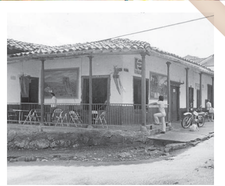
Foto antigua de El Jordán