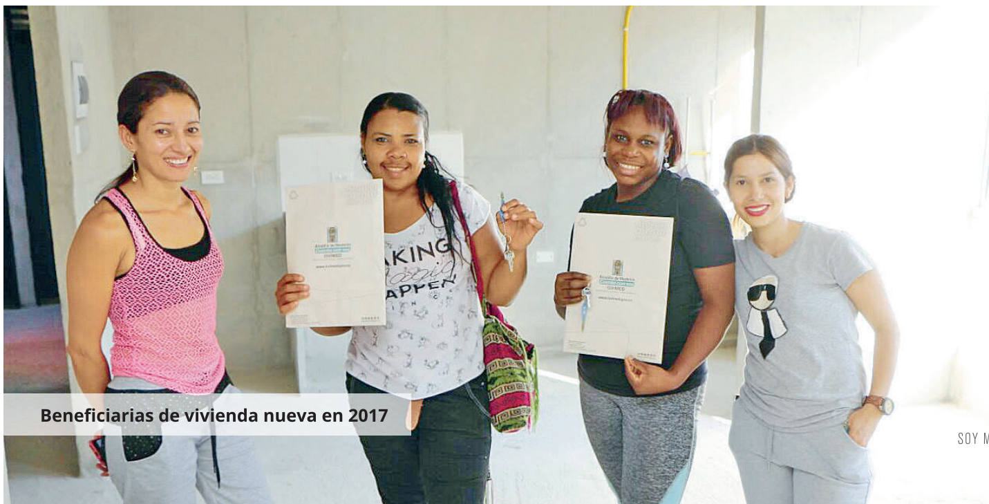
Beneficiarias de vivienda nueva en 2017