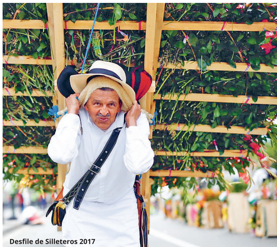
Desfile de Silleteros 2017

sonrisa que le roba a la gente cuando la ve pasar.